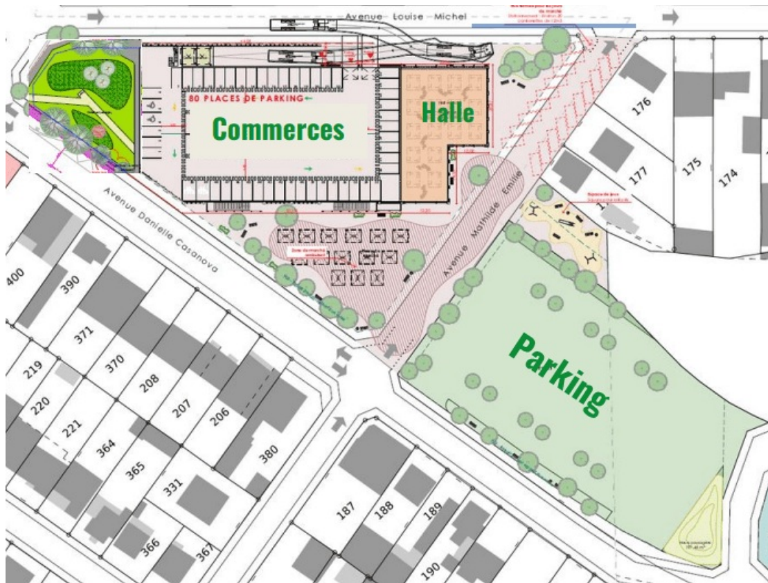
Plan synthèse du réaménagement du quartier Casanova