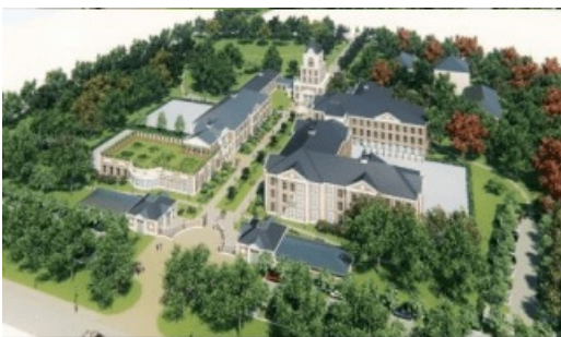
Illustration du Campus trilingue