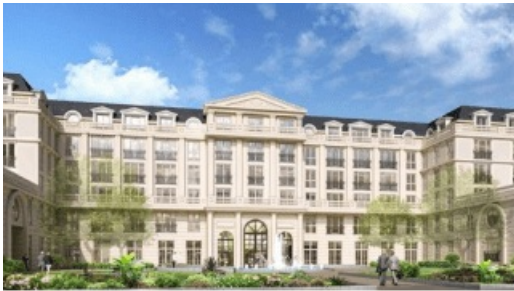
Illustration de la résidence seniors