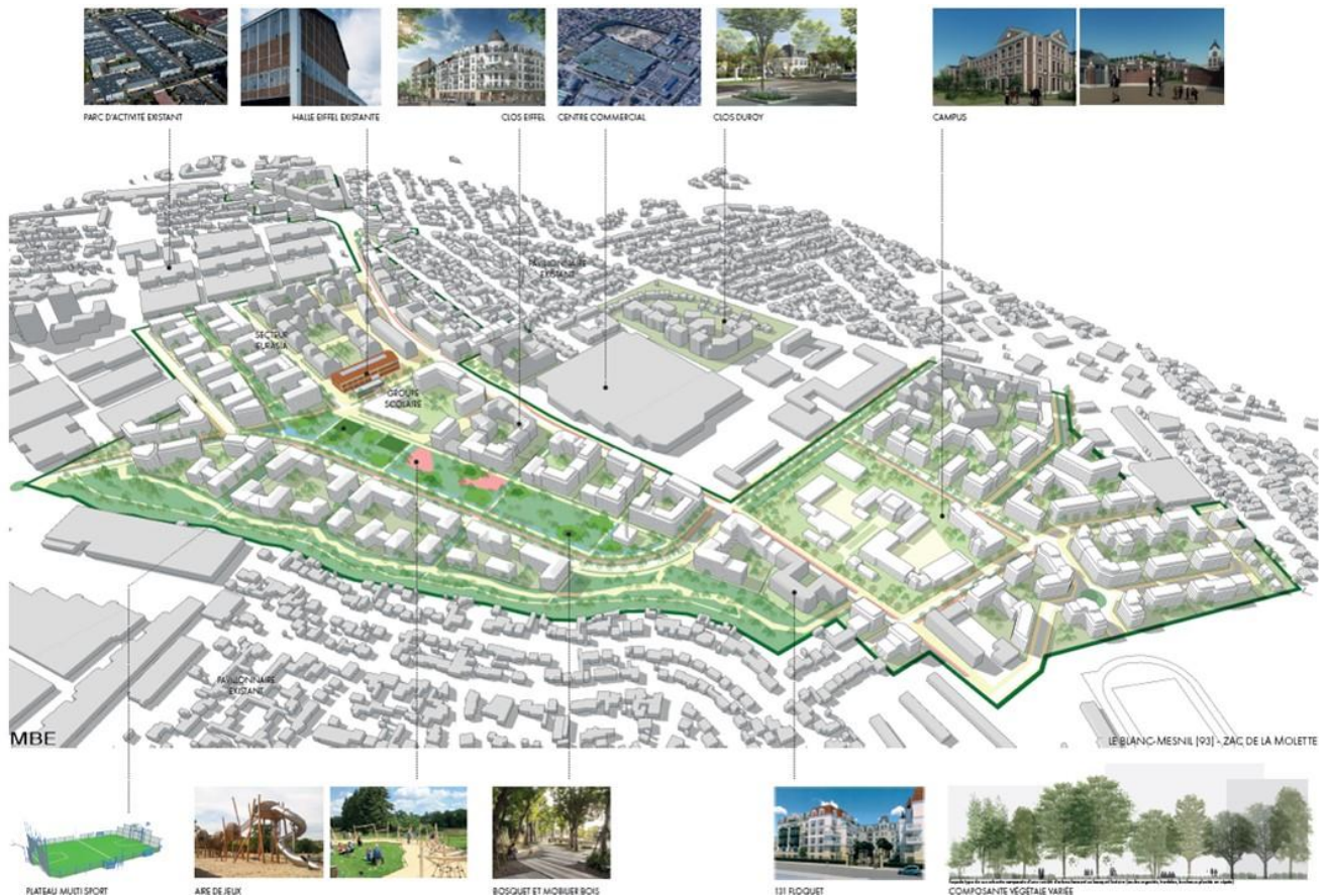
Axonométrie schématique de l'opération d'aménagement