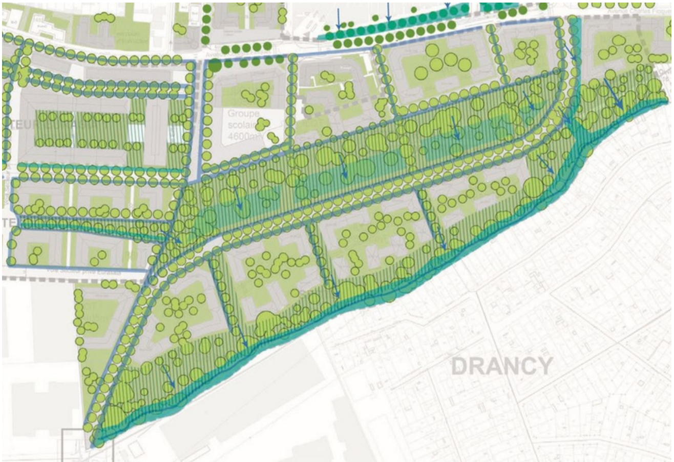
Focus sur les espaces plantés, le parc central et ses alentours