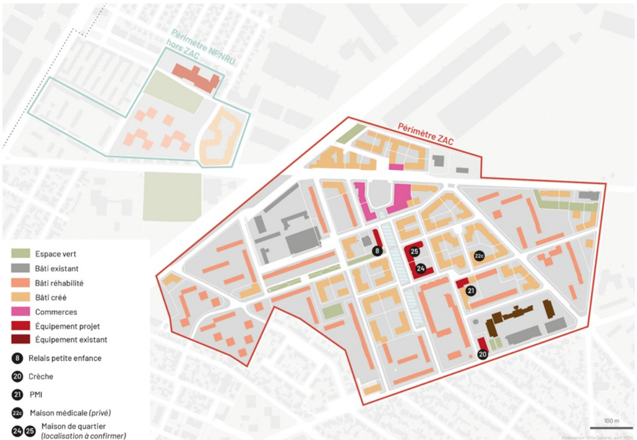
Plan synthèse de l'opération d'aménagement