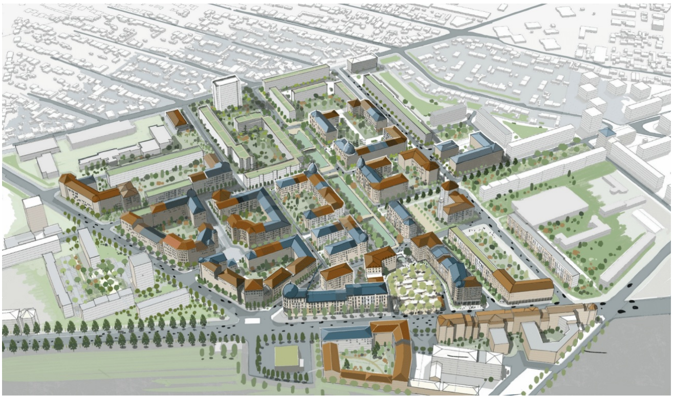
Visuel d'introduction du projet